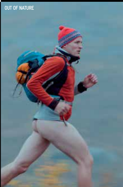
OUT OF NATURE