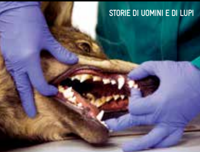
STORIE DI UOMINI E DI LUPI