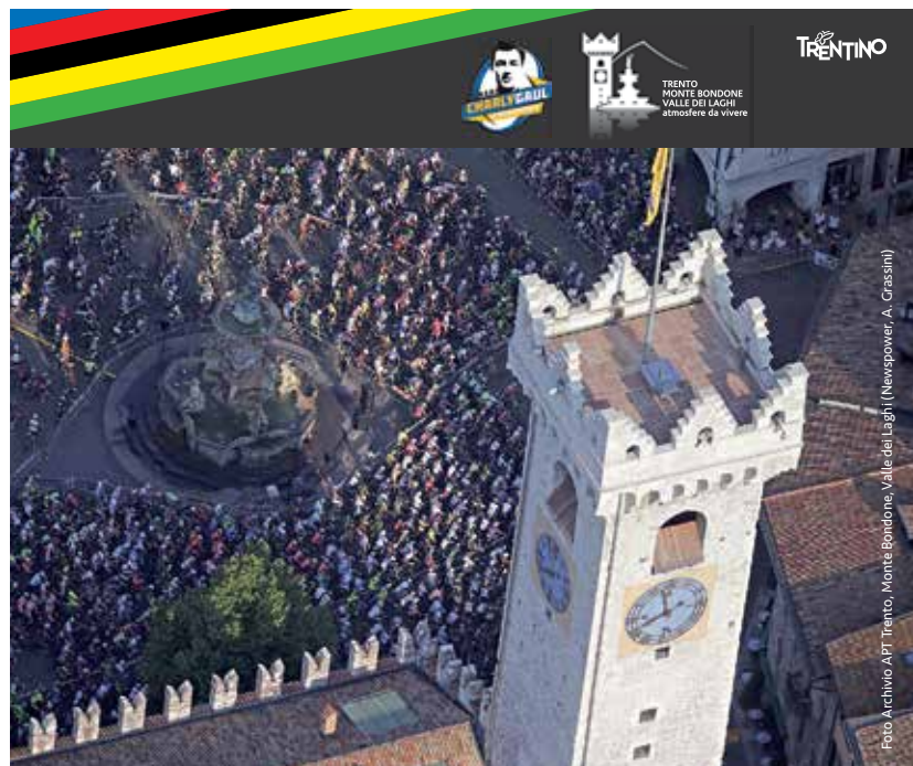
Foto Archivio APT Trento, Monte Bondone, Valle dei Laghi (Newspower, A. Crassin)

Four women hypersensitive to electromagnetic fields decide to move to the French Alps in search of a place sheltered from radiation.