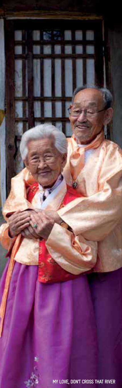
MY LOVE, DON'T CROSS THAT RIVER