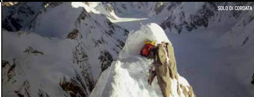
SOLO DI CORDATA